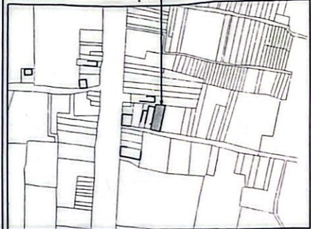
6.3 Vị trí thửa đất

Ghi chú: *Trích lục phục vụ cấp đổi GCN QSD đất 1) 84,0m 2 thuộc HLBV đường bộ 2) Thửa đất thuộc quy hoạch đất ODT+CLN theo quyết định số 412/QĐ- UBND ngày 09/3/2022 của UBND tỉnh Bình Phước